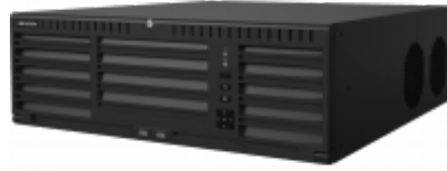
Hình 3: Hình ảnh đầu ghi hình NVR/DVR

Đầu ghi hình NVR/DVR là thiết bị giúp kết nối và quản lý camera IP hoặc camera Analog, đầu ghi hình được phân loại dựa vào số kênh như: 8, 16, 32 hoặc 64 kênh. Giải pháp tương thích với hầu hết dòng đầu ghi hình NVR/DVR đang có trên thị trường hiện nay.