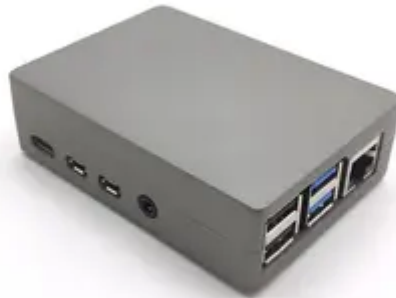
Hình 4: Hình ảnh thiết bị xử lý AI (Box)

Thiết bị xử lý AI (Box) cho phép kết nối camera để quản lý và phân tích AI dựa vào hình ảnh thu được.