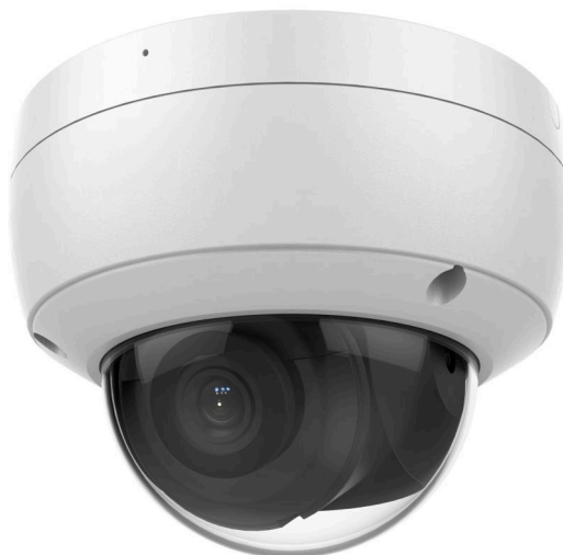
Hình 2: Hình ảnh camera IP

Giải pháp tương thích với hầu hết các dòng camera IP đang có trên thị trường: hikvision, dahua, hanwha... Yêu cầu tối thiểu camera cần đáp ứng bao gồm: